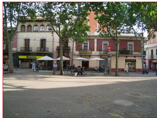
La Plaça d'Eivissa avui