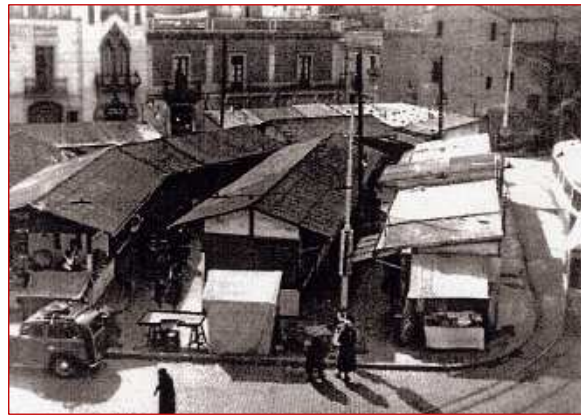
Plaça d'Eivissa quan era la plaça del Mercat fins el 1951 en els barris de Barcelona, Enciclopèdia Catalana i Ajuntament de Barcelona. 2000