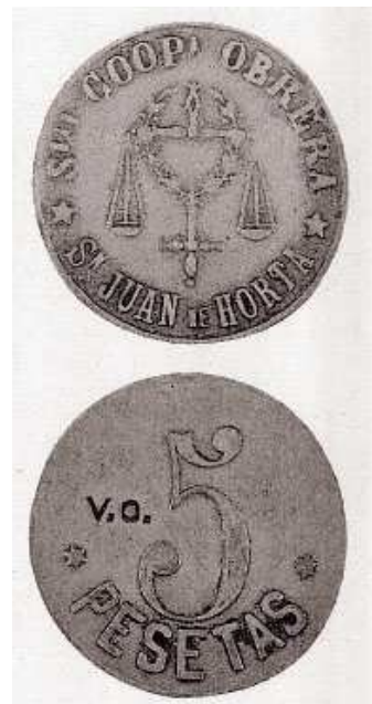
Monedes utilitzades per les cooperatives obreres a Horta, en els barris de Barcelona, Enciclopèdia Catalana i Ajuntament de Barcelona. 2000